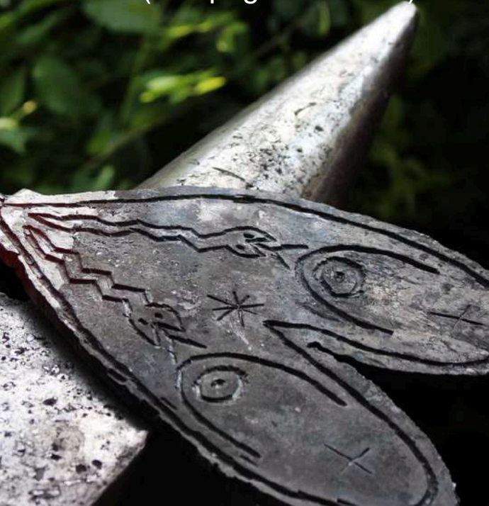
Les oublies, fabriqués par Charles Husser (compagnie Titanos)

Démarrées en 2020 lors de la résidence de recherches proposées par la région Grand Est, ces expérimentations se créent au fil des occasions et des rencontres. Ces projets se développeront entre 2025 et 2028 où l’objectif sera de présenter un travail complet autour de la fonction nourricière dans la fête foraine et de créer un banquet festif spectaculaire avec toutes ces créations misent en vie dans un ensemble esthétique cohérent et une unité globale.