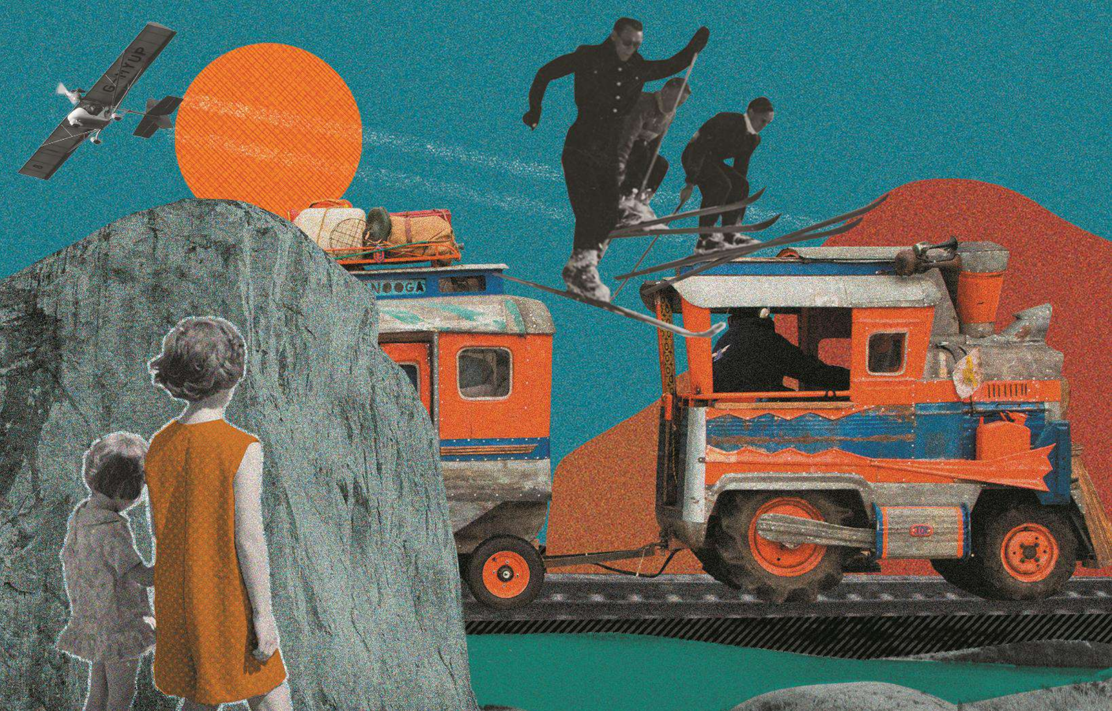
IMPERIAL TRANS-KAIROS COMPAGNIE TITANOS - AGITATION FORAINE Création 2019 // Spectacle de rue